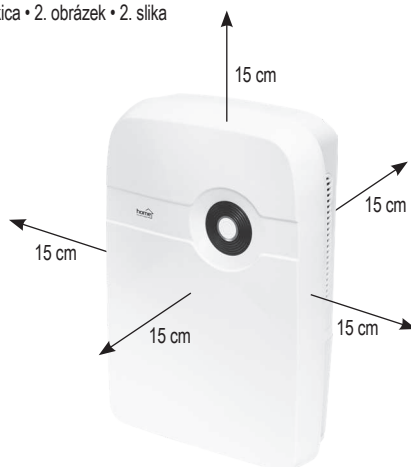
figure 2. • 2. ábra • 2. obraz • figura 2. • 2. skica • 2. obrázek • 2. slika